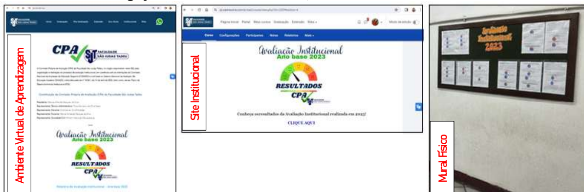
Elaborado pela Comissão Própria de Avaliação