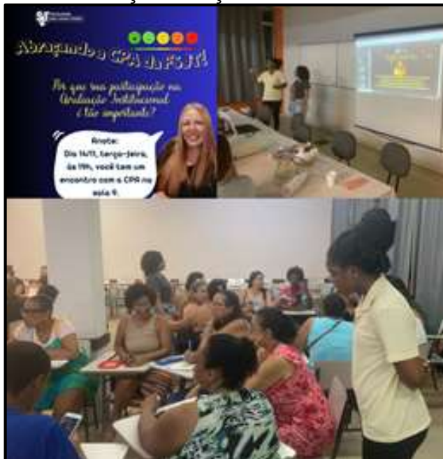
Elaborado pela Comissão Própria de Avaliação

A sensibilização da comunidade acadêmica, administrativa e da sociedade civil organizada é realizada por meio de diferentes ações estratégicas, tais como: